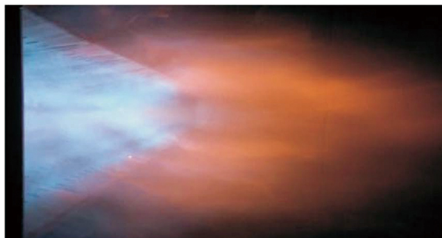
热风专用线性燃烧器